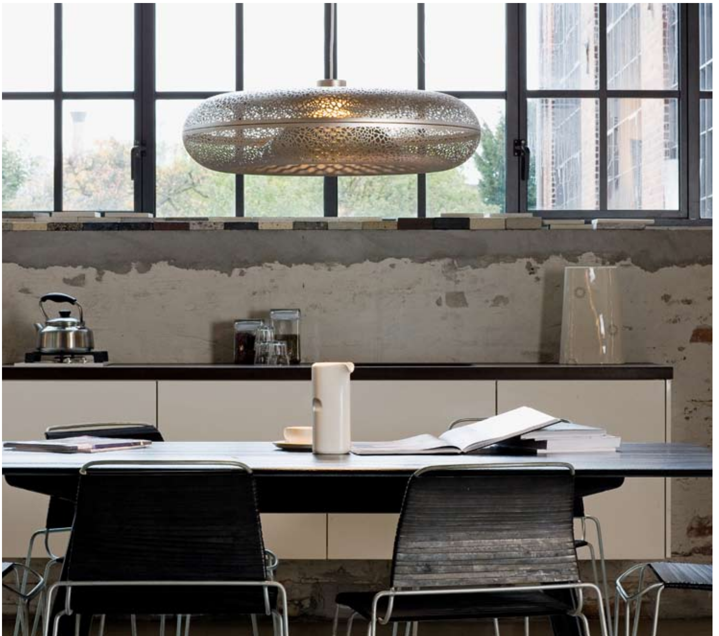
Studio photo Photo Kaslov Studio